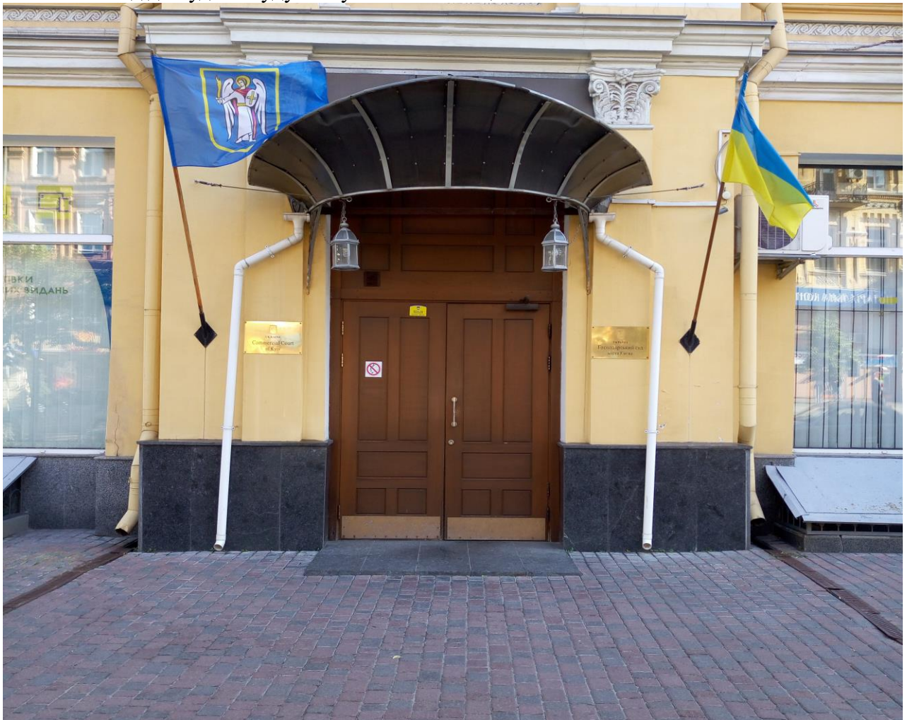
Головний вхід до будівлі суду по вул. Б.Хмельницького №44-А